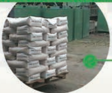
Conditionnement en palette